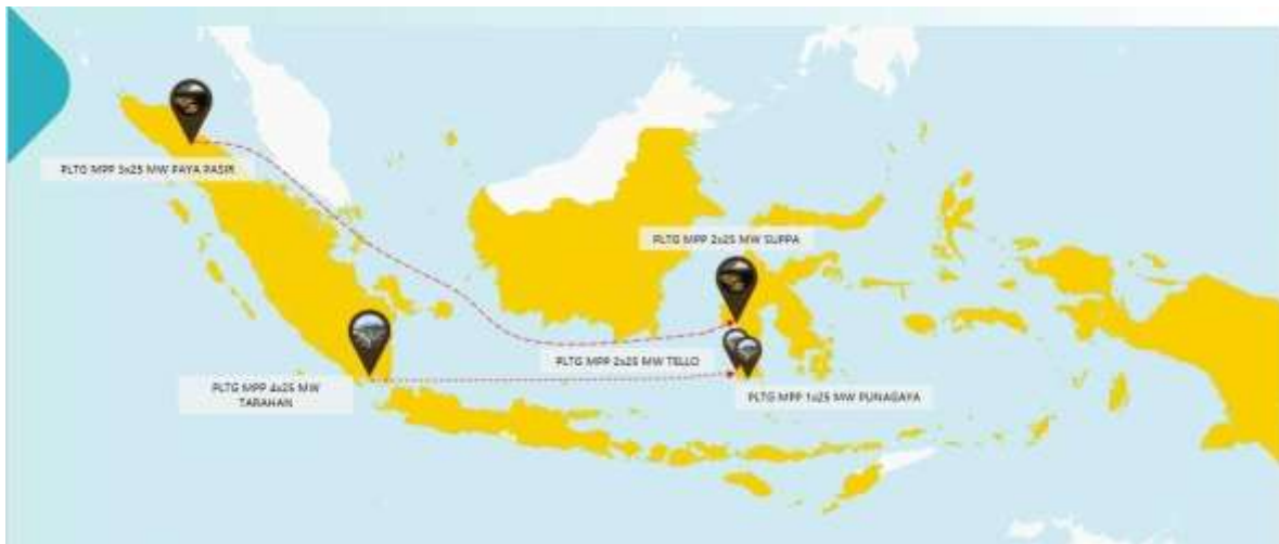
Gambar 3. Peta Proyek Relokasi PT. PLN Batam Dari Sistem Kelistrikan Sumatera Ke Sulawesi Selatan