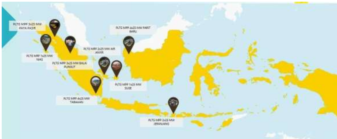
Gambar 1. Lokasi Mobile Power Plant Tersebar Milik PT. PLN Batam

Penelitian ini dilatarbelakangi oleh krisis energi di sistem kelistrikan Sulawesi Selatan pada tahun 2023 akibat fenomena El Nino yang menurunkan debit air pada PLTA utama, serta keterbatasan unit pembangkit berkemampuan blackstart . Kondisi ini berbanding terbalik dengan wilayah Lampung yang mengalami oversupply . Penelitian ini bertujuan menganalisis kelayakan relokasi 1 unit TM2500+ dari PLTG MPP Tarahan, Lampung, ke Punagaya, Sulawesi Selatan.